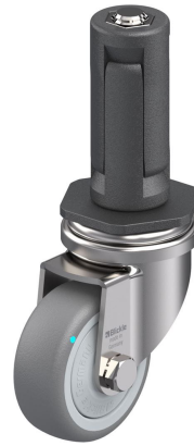
Roulette pivotante correspondante LRXA-TPA 50KFD-EXR03