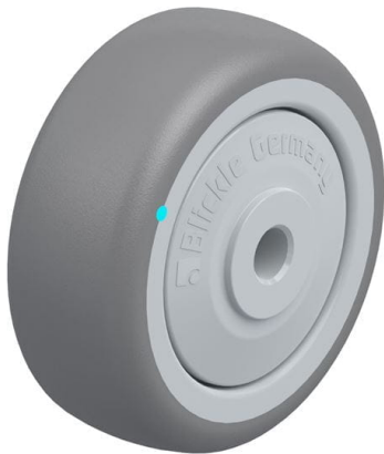
Roue utilisée TPA 50/6KFD