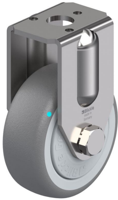
Roulette fixe correspondante BRXA-TPA 50KFD