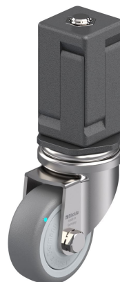
Roulette pivotante correspondante LRXA-TPA 50KFD-EXV07