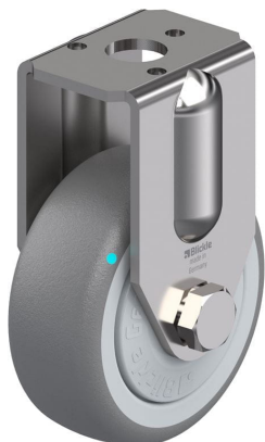
Roulette fixe correspondante BRXA-TPA 50KFD