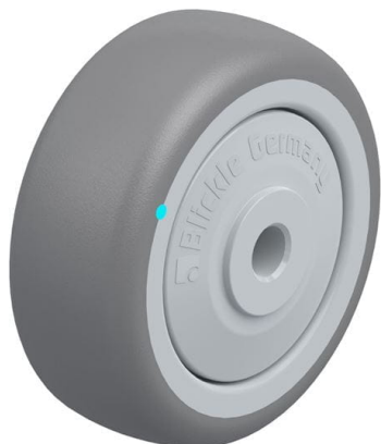
Roue utilisée TPA 50/6KFD