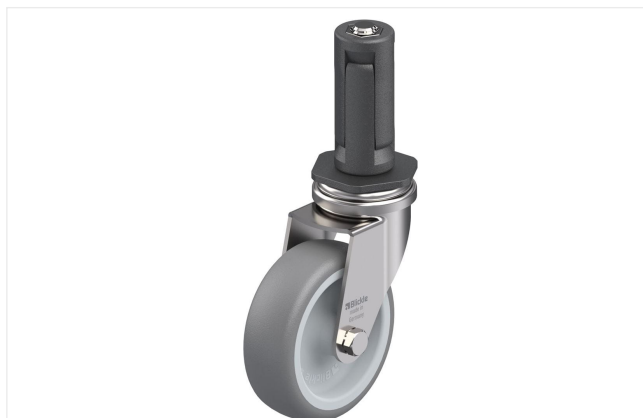
Roulette pivotante correspondante LRXA-TPA 75G-EXR03