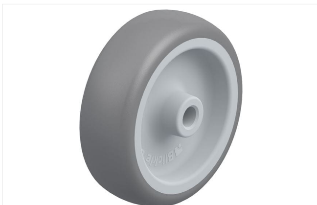
Roue utilisée TPA 75/8G