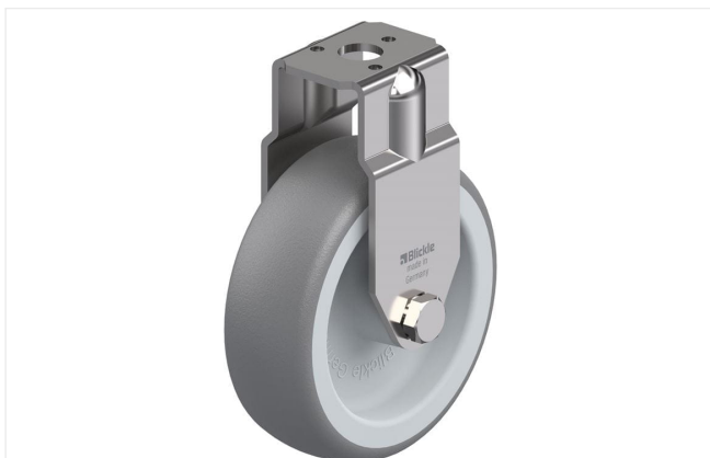
Roulette fixe correspondante BRXA-TPA 75G