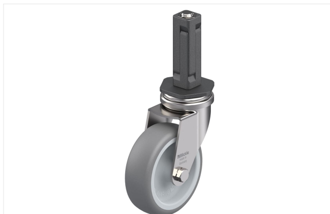
Roulette pivotante correspondante LRXA-TPA 75G-EXV02