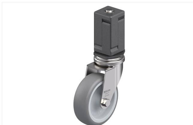
Roulette pivotante correspondante LRXA-TPA 75G-EXV07