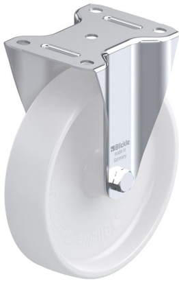
Roulette fixe correspondante B-PO 200G