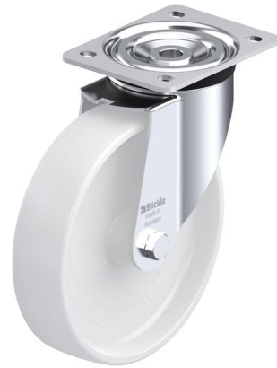
Roulette pivotante correspondante L-PO 200G