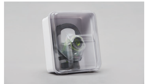
C90 – Boîtier mural.