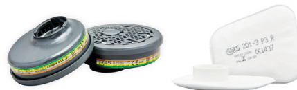
Filtres BLS 200 series