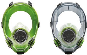
Masques complets BLS 5700 - BLS 5600