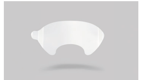
K19 – Film de protection en acétate.