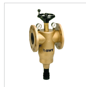
Filtre BWT INFINITY