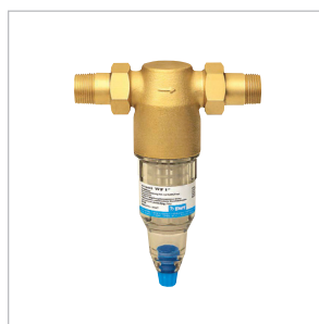
Filtre BWT AVANTI WF