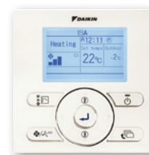
En option (BRC073)