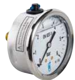
216 Ø 63 RA