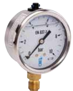
216 Ø 63 RV