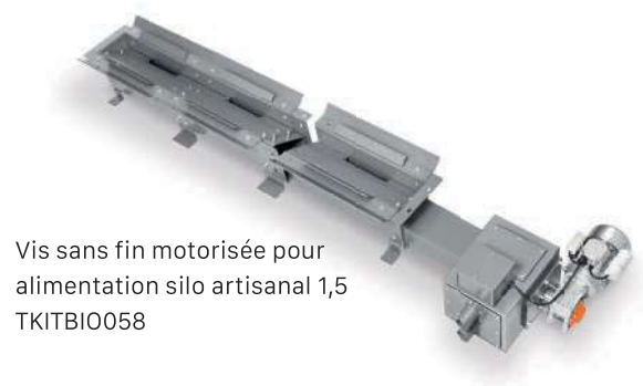
Vis sans fin motorisée pour alimentation silo artisanal 1,5 TKITBIO058