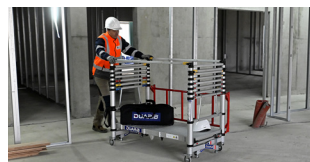
+ Utilisable en mode chariot