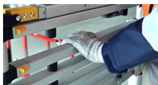
+ Système anti-pince-doigt perfectionné