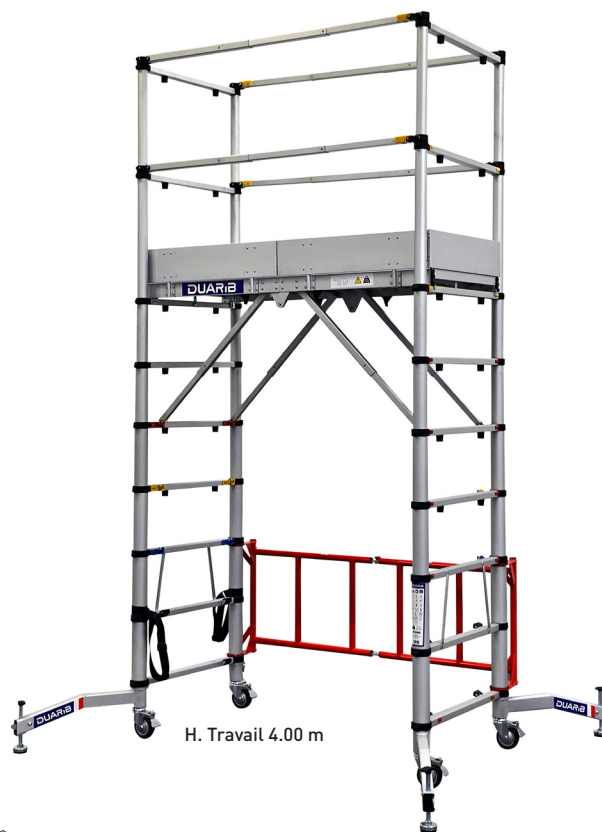
H. Travail 4.00 m