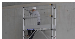
+ Passage de trappe élargi