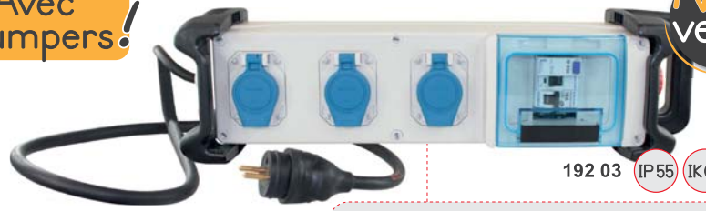
192 03 IP55 IK07