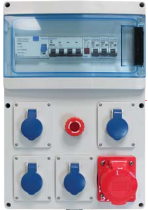
192 10 / 192 11 IP44 IK07