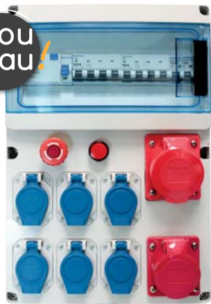
192 12 IP44 IK07