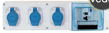
192 02 IP55 IK07