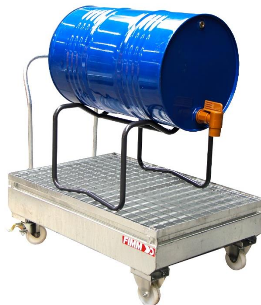
845 006 639 – 2 fûts

Présenté avec le support de soutirage 840 007 779