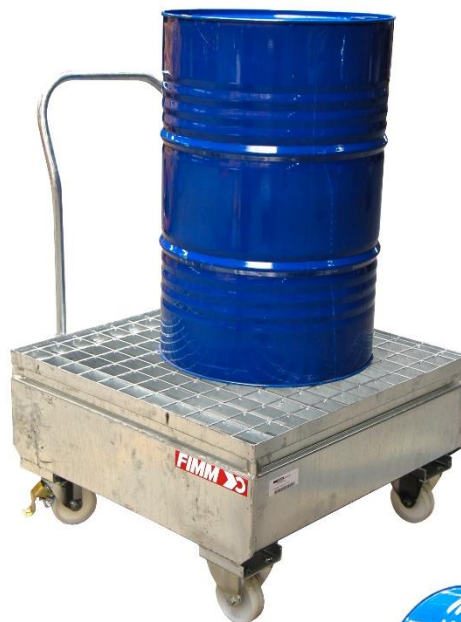
845 006 638 – 1 fût