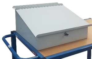
882 006 039 – Pupitre à poser avec écritoire verrouillable 440 x 520 mm.