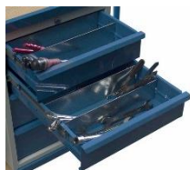
882 006 036 – Cloisonnements pour tiroirs hauteur 100 mm. 6 cloisons incluses.