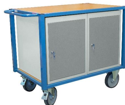
Modèles en blocs porte