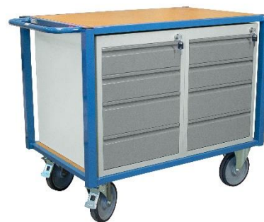
Modèles en blocs 4 tiroirs