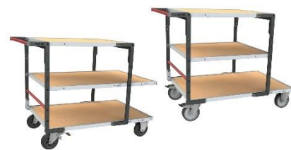
Différentes combinaisons de plateaux