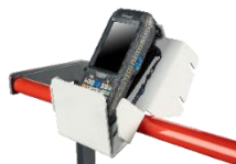
Porte-douchette 882 006 149