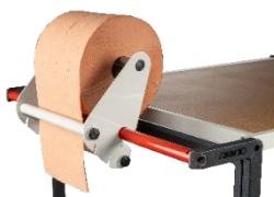
Dévidoir 882 006 152 Pour rouleaux Ø 300 mm maxi.