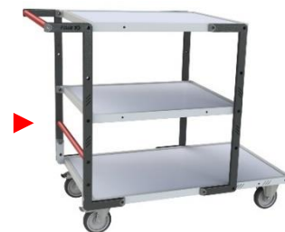
Barre de maintien Évite la chute d'objets Plateaux taille S : 802 000 017 Plateaux taille M : 802 000 018