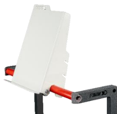
Porte-documents format portrait A4 882 006 150