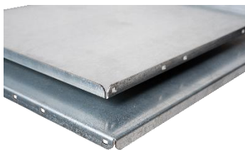
Plateau tôle galva avec ou sans rebord de 16 mm.