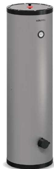
Mileo Inox +