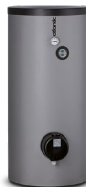
Mileo / Mileo +