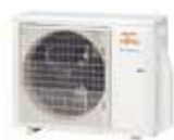
AOYG 18 KMT