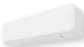
ASYG 18 KMTB