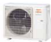
AOYG 24 KMT