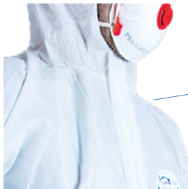
Rabat autocollant pour une étanchéité totale