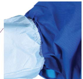
Élastique de serrage au niveau du biceps