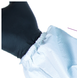
Élastique de serrage au niveau du poignet