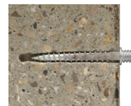
Patte à vis ING - vue en coupe