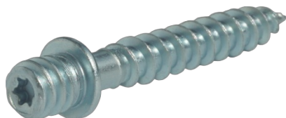
Patte à vis ING - finition zinguée blanche