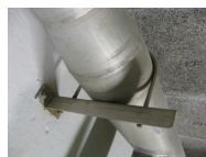
Etrier - vue en situation