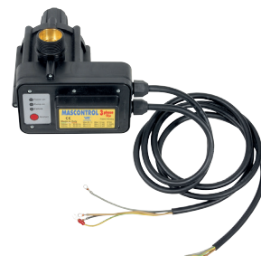
MASCONTROL UP TRI triphasé jusqu'à 2,2 kW