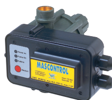
MASCONTROL jusqu'à 2,2 kW