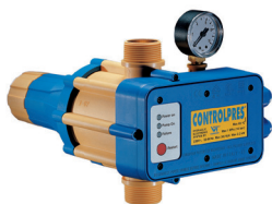
CONTROLPRES jusqu'à 2,2 kW. Régulation de la pression de sortie entre 3 et 6,5 bars.