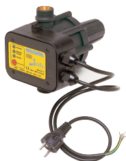
PRESSCONTROL UP CÂBLÉ réarmement automatique jusqu'à 1,1 kW