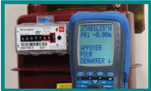
Etanchéité des installations gaz