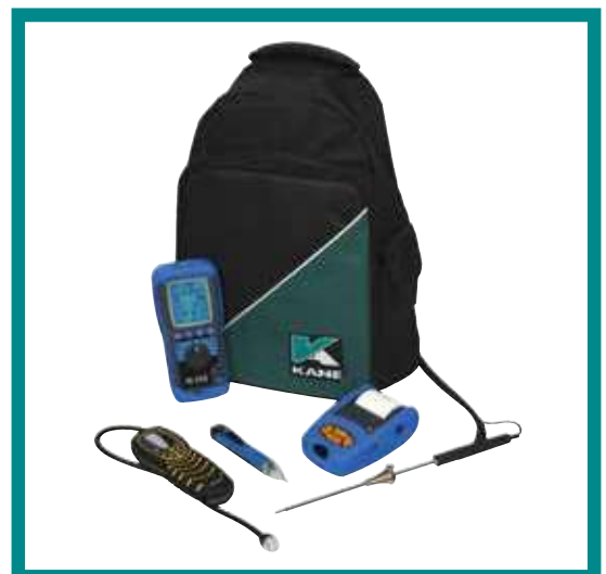
KANE458EK 1255€ HT