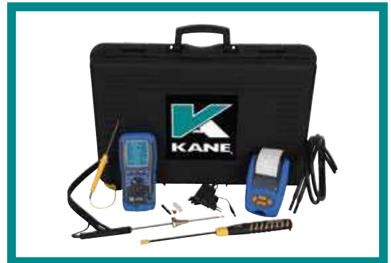
KANE458KITGAZ 1235€ HT