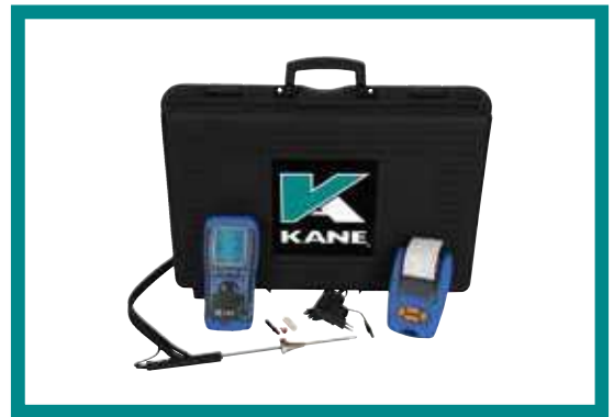
KANE458KITPRO 1095€ HT