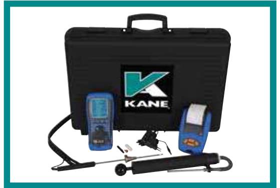
KANE458KITPRO+ 1185€ HT