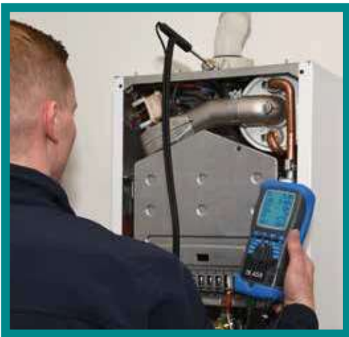
Analyse de gaz