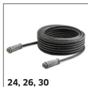
24, 26, 30