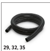
29, 32, 35