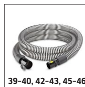
39-40, 42-43, 45-46