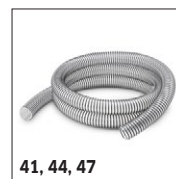
41, 44, 47