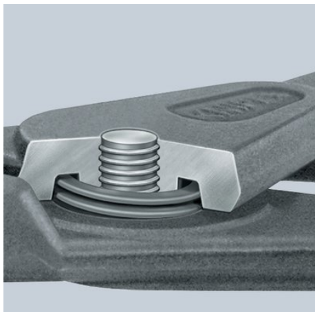
Ressort intégré: le ressort est protégé à l'intérieur de la charnière de précision vissée. Ne gêne pas pendant le travail, pas d'encrassement ni de perte