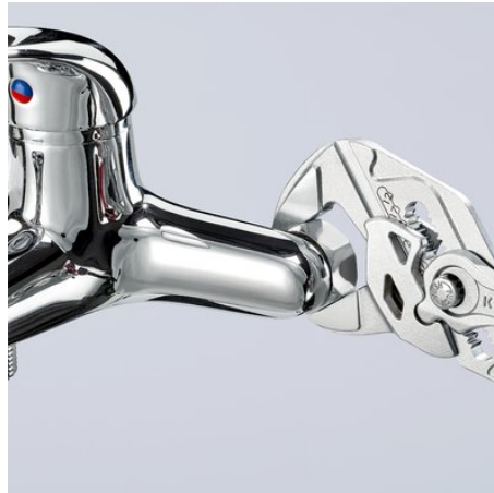
Pour robinetteries chromées sans endommager la surface