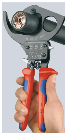
Principe du cliquet et entraînement par couronne dentée à 2 positions pour une coupe moins fatigante