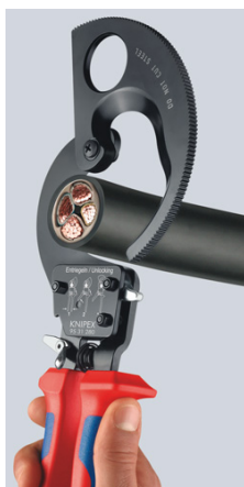
95 31 280: grande capacité de coupe: diam. max. de 52 mm/380 mm 2