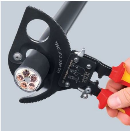
Principe du cliquet et entraînement par couronne dentée à 2 positions pour une coupe moins fatigante

Sous réserve de toute modification technique et erreur.