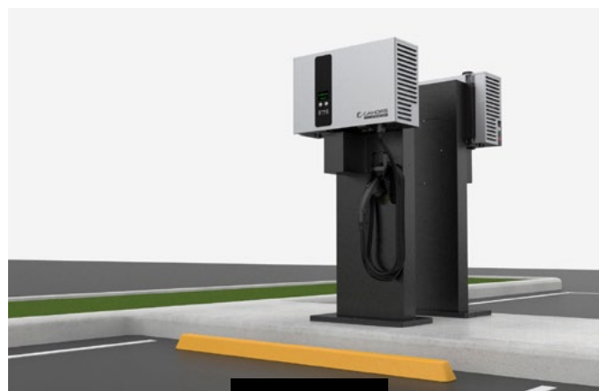
Référence pied de fixation : 13P2850102