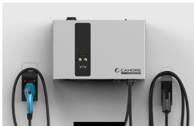
Version 2 points de charge (Combo2 + CHAdeMO)