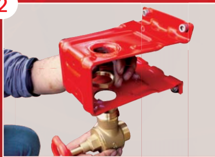
Positionnement du robinet d'arrêt