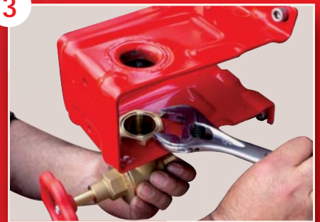
Fixation du robinet d'arrêt