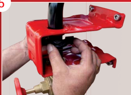
Maintien en position de l'ensemble bobine et tube d'alimentation par un seul collier