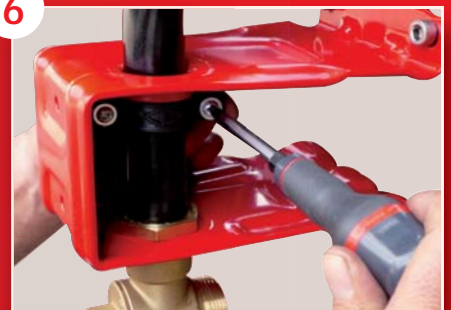
Assemblage du collier par deux vis