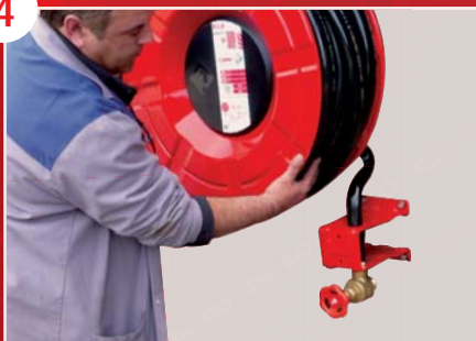
Mise en place du dévidoir par une seule personne