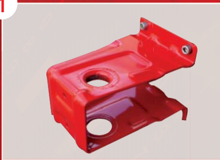
Fixation du support mural indépendamment du RIA