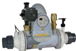
Plus avec circulateur