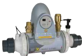
Plus sans circulateur