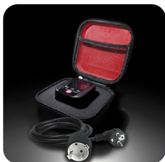
Livré avec étui rigide et prolongateur

Accessoire optionnel : SA165 : kit de mesure pour tableaux électriques