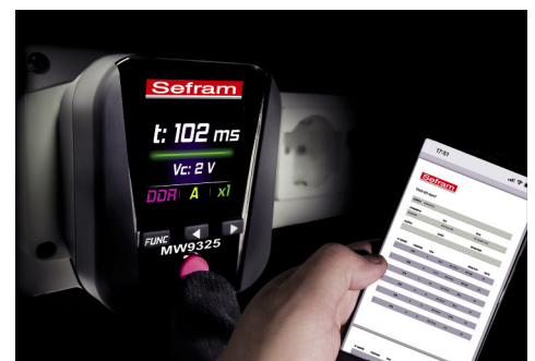
Rapport de test via l'application SEFRAM REPORT (compatible Android et iOS)