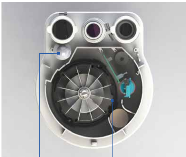
Dispositif ultra performant à clapet d'évent évitant la remontée de mousse