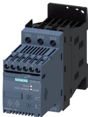
Démarrateurs progressifs SIRIUS, taille S00 3,6 A, 1,5 kW/400 V, 40 °C 200-480 V CA, 24 V CA/CC bornes à vis