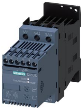
Démarrateurs progressifs SIRIUS, taille S00 3,6 A, 1,5 kW/400 V, 40 °C 200-480 V CA, 110-230 V CA / CC bornes à vis