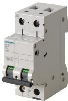
Figure à titre d'exemple

Disjoncteur modulaire 400V 4.5kA, 2 pôles, C, 1A