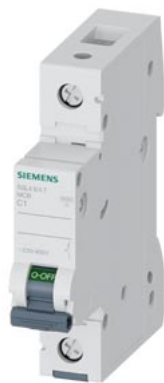
Disjoncteur modulaire 230/400V 10kA, 1 pôle, C, 1A