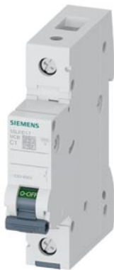
Disjoncteur modulaire 230/400V 6kA, 1 pôle, C, 1A