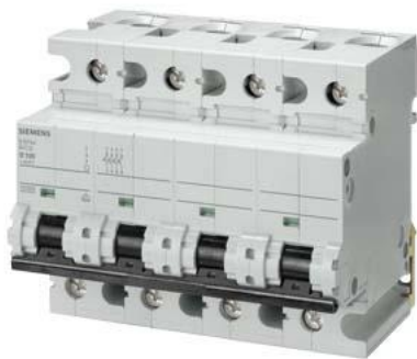
Figure à titre d'exemple

Disjoncteur modulaire 400V 10kA, 4 pôles, B, 80A, T=70mm