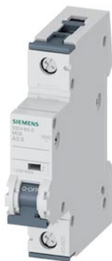
Disjoncteur modulaire 230/400V 10kA, 1 pôle, A, 0.5A, T=70mm