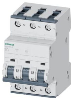
Disjoncteur modulaire 400V 10kA, 3 pôles, A, 0.5A, T=70mm