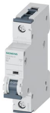
Disjoncteur modulaire 230/400V 6kA, 1 pôle, B, 2A, T=70mm