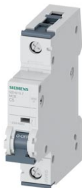
Disjoncteur modulaire 230/400V 6kA, 1 pôle, C, 5A