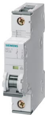
Disjoncteur modulaire 230/400V 15kA, 1 pôle, C, 1A, T=70mm