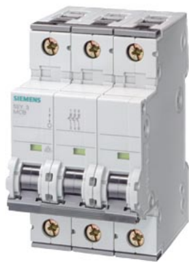
Disjoncteur modulaire 400V 15kA, 3 pôles, C, 32A, T=70mm