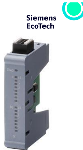
SIMATIC S7-1200 G2 : module de sorties analogiques SB 1232, 4 AO ; sorties : 4 x AQ 14 bits DAC (+/-10V, 0-20mA ou 4-20mA)