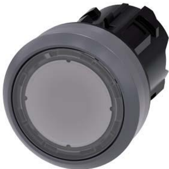
Figure à titre d'exemple

VOYANT LUMINEUX (BOUTON-POUSOIR LUM. DESIGN), 22MM, ROND, PLASTIQUE, COLLERETTE METAL, TRANSPARENT